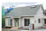
若草色の三角屋根が印象的なDさん宅

窓が数多く、開放的な間取りに大容量の小屋裏収納を設け、明るく広々と暮らせるDさん宅。「担当者は誠実。上手に要望を引き出してカタチにしてくれました」と話す。