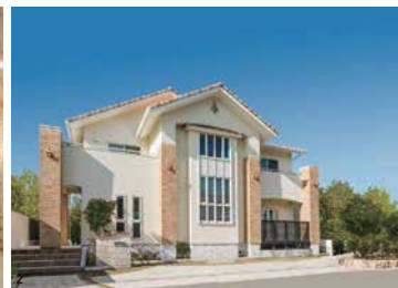
1 / 公開中の「第一モデルハウス」（左）と「第二モデルハウス」（右）。『第二モデルハウス』は外断熱+内断熱のW断熱を採用。構造やプラン、内装など2棟を見比べて体感可能。2 / 縦長の窓、レンガと塗り壁が優美な印象の外観（2・3は『第一モデルハウス』） 3 / 天井の羽目板とコーナー装飾が上質を演出。明るく開放的な吹抜けのリビング