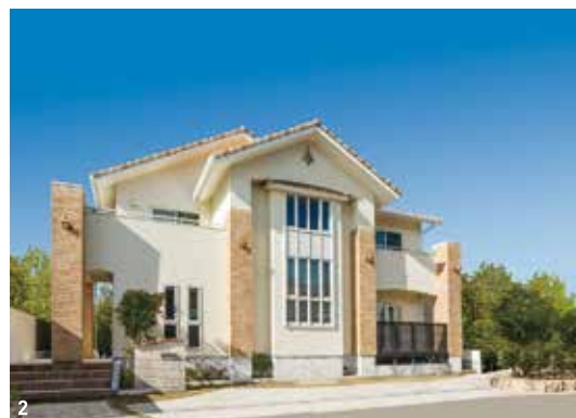
1 / 「第一モデルハウス」(左)と「第二モデルハウス」(右)。「第二モデルハウス」は外断熱+内断熱のW断熱を採用。構造やプラン、内装などが異なる2棟を見比べよう 2 / 縦長の窓、レンガと塗り壁が優美な印象の外観(2・3・4は「第一モデルハウス」) 3 / 明るく開放的な吹き抜けのリビング。天井の羽目板とコーナー装飾が上質さを演出