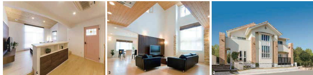
1 / 「第一モデルハウス」（左）と「第二モデルハウス」（右）は構造やプラン、内装などが異なる2棟が並び見ごたえがある。「第二モデルハウス」は外断熱+内断熱のW断熱を採用 2 / 縦長の窓、レンガと塗り壁が優美な印象の外観（2・3は「第一モデルハウス」） 3 / 吹抜けの明るいリビング。天井の羽目板とコーナー装飾が上質を物語る