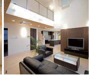
1/「第一モデルハウス」(左)と「第二モデルハウス」(右)。デザインも工法も違う2棟のモデルハウスの見学が可能 2/吹き抜けで2階とつながる明るいリビング。コミュニケーションが深まる設計が得意 (2・3・4は「第一モデルハウス」) 3/天井の羽目板とコーナー装飾がぬくもりを演出 4/腰板や縁甲板に古板を採用したレトロな和室