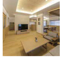
折り上げ天井やステンドグラスが素敵