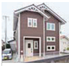
輸入住宅風の可愛い外観

「建築現場を毎日見に来ましたが、大工さんの技術と丁寧さに感心しました」と話さず。階段を吹き抜けにするなど、家族の気配が感じられる、つながる間取りを希望。無垢材を多用した家は空気感が良く、毎日が快適だそう。