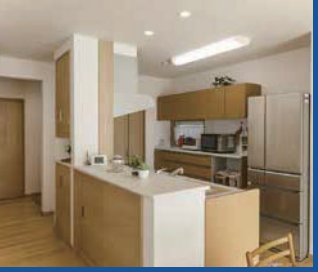
Nさん邸は外構も杜和建設に依頼。1階は26畳の開放的なLDKに家族共有の書斎コーナーを設け、アイランドキッチンからパントリー経由で洗面室に抜ける家事動線も便利だ