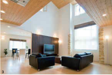
2/吹き抜けで2階とつながる開放的なリビング。家族のコミュニケーションを育む動線を提案 (2・3・4は「第一モデルハウス」)