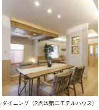
ダイニング (2点は第二モデルハウス)