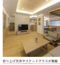
折り上げ天井やステンドグラスが素敵