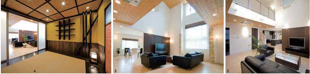
1/塩釜市にある2棟のモデルハウス。デザインも工法も違う「第一モデルハウス」(左)と「第二モデルハウス」(右) 2/吹き抜けで2階とつながる開放的なリビング。家族の触れあいを育む動線を提案 (2・3・4は「第一モデルハウス」) 3/温かみを出す天井の羽目板とコーナー装飾 4/腰板や緑甲板に古板を採用した古民家風の和室