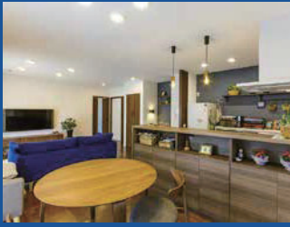
片流れの屋根にブラックの外壁、家具やカーテンはアクセントクロスに合わせてブルーで統一するなどインテリアにもこだわった。週末も家で過ごすのが楽しいそう (Tさん邸)