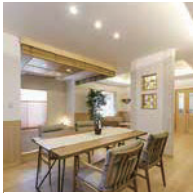
ダイニング (2点は第二モデルハウス)